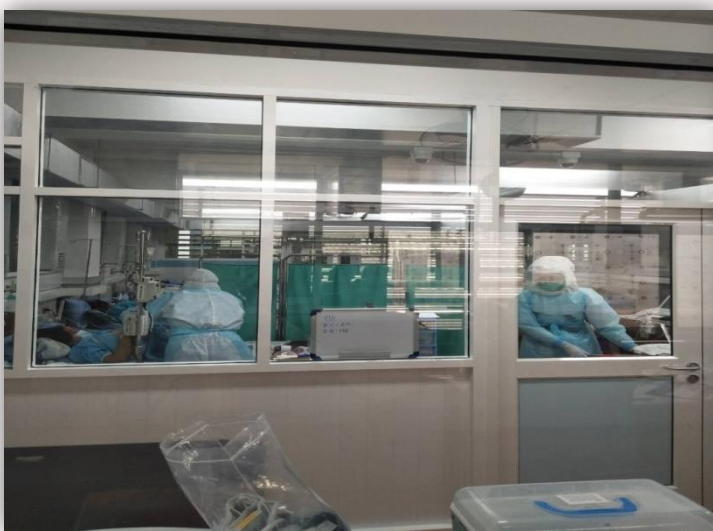
ภาพที่ 2. ผู้ป่วยได้รับการเตรียมความพร้อมก่อนผ่าตัด