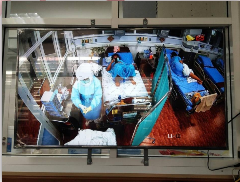
ภาพที่ 1. ผู้ป่วยได้รับการเตรียมความพร้อมก่อนผ่าตัด