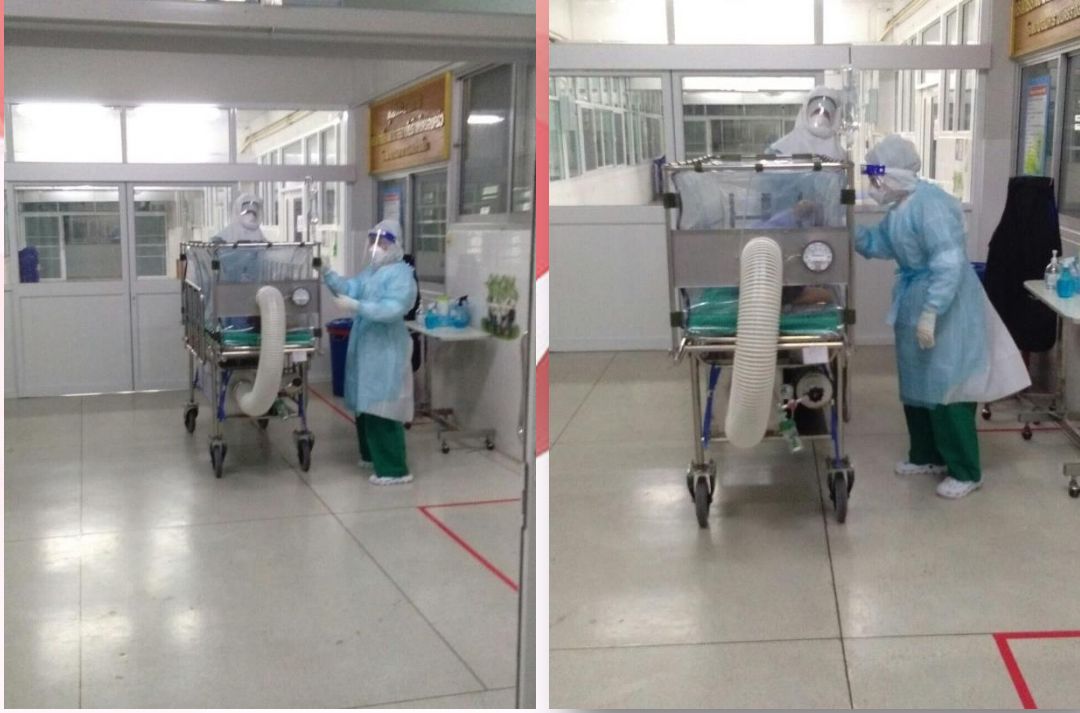
ภาพที่ 4. ตรวจสอบความพร้อมผู้ป่วยก่อนส่งไปห้องผ่าตัด