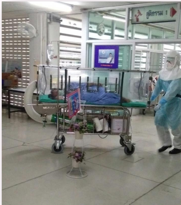
ภาพที่ 5. ส่งผู้ป่วยไปห้องผ่าตัดอย่างปลอดภัย